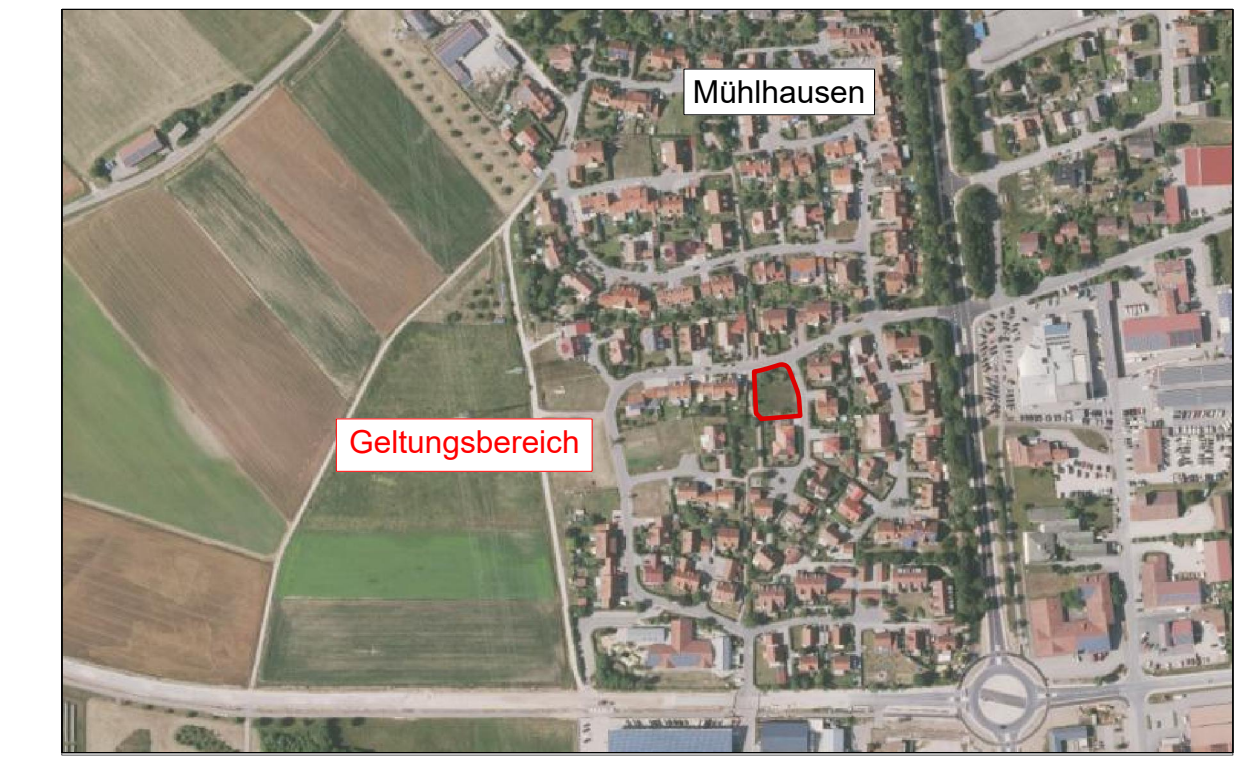
Übersichtslageplan, M 1:10.000

GEMEINDE MÜHLHAUSEN LANDKREIS NEUMARKT FLURNR.: 471/19, 471/20 DER GEMARKUNG MÜHLHAUSEN