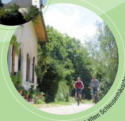
Radler an altem Schleusenhäuschen