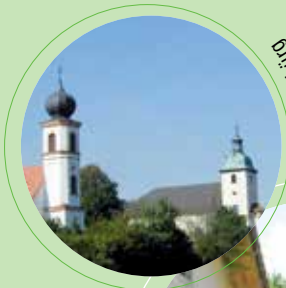
Sulzbürg Kirchen, Sulzbürg

Die Preise enthalten 7% MwSt. Preisstand: 1.1.2017