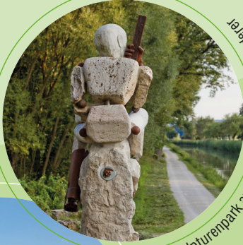
Skulpturenpark am Kanal