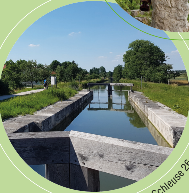
Mühlhausen, Schleuse 26