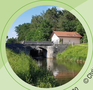
Sengenthal, Schleuse 30