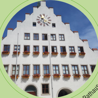
Neumarkt, Rathaus