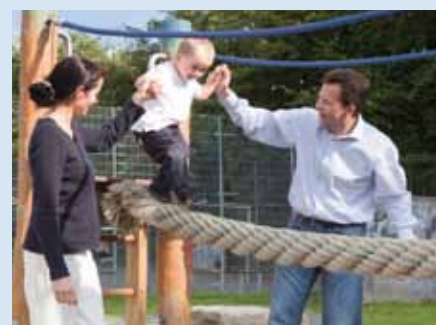
Die Geräte in den GIB-Parks sind für unterschiedliche Körperpartien ausgelegt. Damit sind Spiel, Spaß und Bewegung für Jung und Alt garantiert.