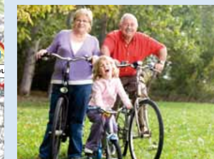
Alle GIB-Parks liegen am gut ausgebauten Radwegenetz im Landkreis Neumarkt. Alle Touren eignen sich für die ganze Familie.

SENGENTHAL-BUCHBERG Im Ortsteil Buchberg wurde der GIB-Park in der Grünanlage an der Waldstraße in der neuen Ortsmitte errichtet und bietet in Zusammenhang mit dem Wanderzirkus um den Buchberg eine sportliche Ergänzung für Jung und Alt, für Einheimische und Gäste.